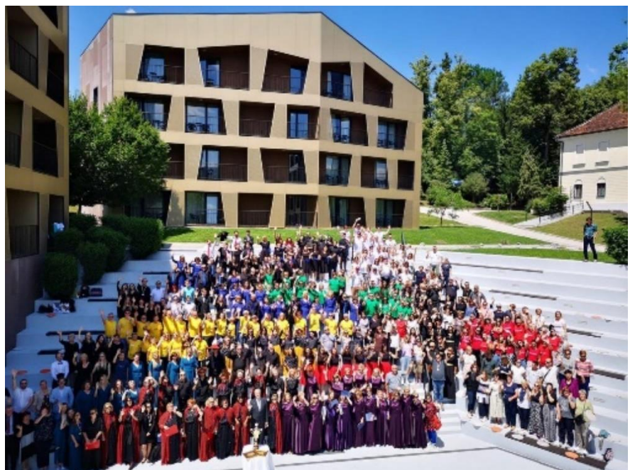
Terme Tuhelj – 13. Zlatna lipa Tuhlja, 11.06.2022