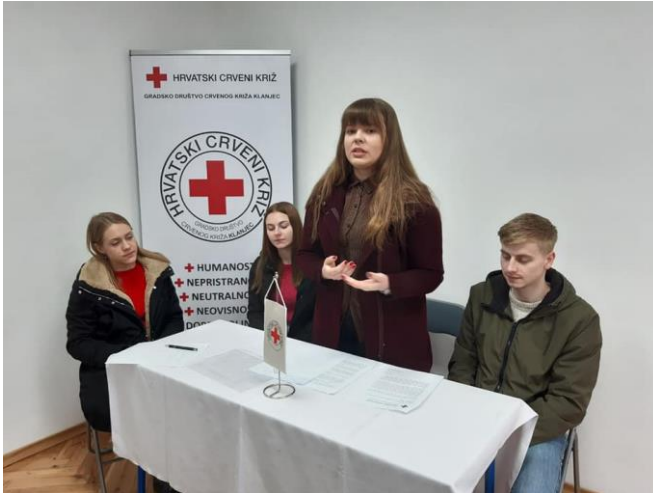
Vodstvo Kluba mladih GDCK Klanjec, 02.04.2022.

Gradskom društvu Crvenog križa Klanjec isplaćen je dio zakonske obveze u iznosu od 10.000,00 kn.