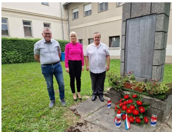
Obilježavanje Dana antifašističke borbe, 21.06.2022.