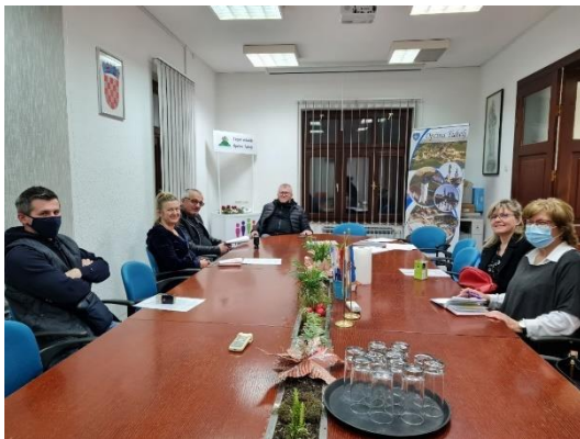
Općinska vijećnica – potpisivanje ugovora, 23.03.2022.

Na javni natječaj za financiranje programa i projekata od interesa za opće dobro koje provode udruge na području Općine Tuhelj za 2022. godinu pristiglo je 11 prijavljenih projekata/programa od 10 udruga. Dana 18.03.2022. godine načelnik je donio Odluku o dodjeli financijskih sredstava za financiranje programa i projekata od interesa za opće dobro koje provode udruge na području Općine Tuhelj za 2022. godinu, dok je 22.03.2022. godine Općina potpisala ugovore o financiranju istih.