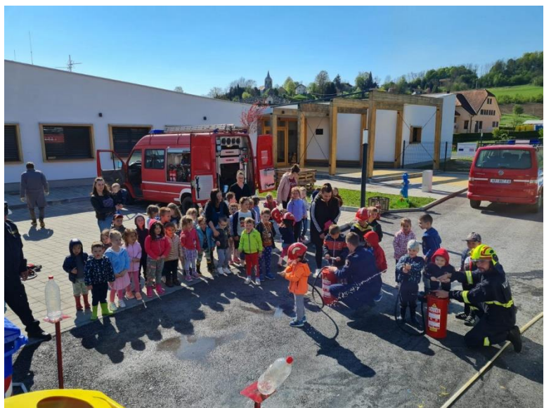
Vatrogasci u DV Potočić Tuheljski, svibanj 2022.

Sukladno Zakonu o vatrogastvu u tijeku prvog polugodišta 2022. godine DVD-u Tuhelj isplaćena su novčana sredstva u iznosu od 72.000,00 kuna.