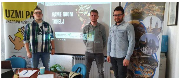
Predstavljanje ideje – članovi Savjeta mladih i pročelnik, 29.04.2022.