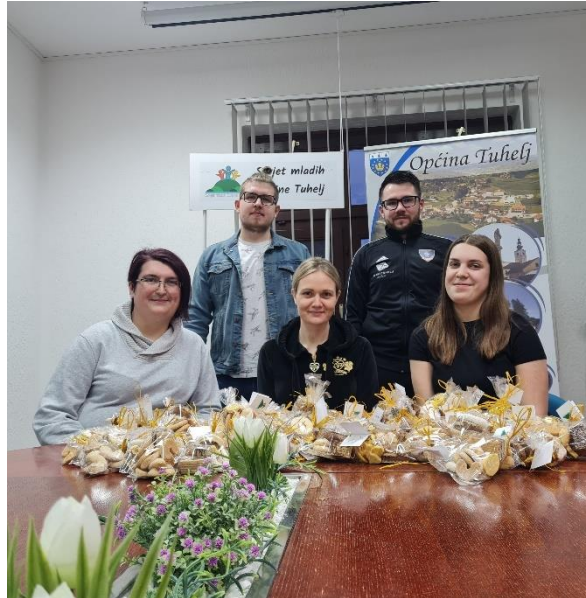
Savjet mladih, travanj 2022.