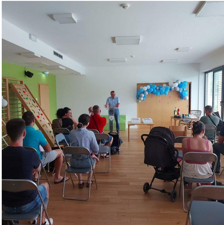
Dječji vrtić Potočić Tuheljski, prijem novorođene djece 29.06.2022.

Posebna briga vodi se o socijalno ugroženom stanovništvu općine što čine troškovi: