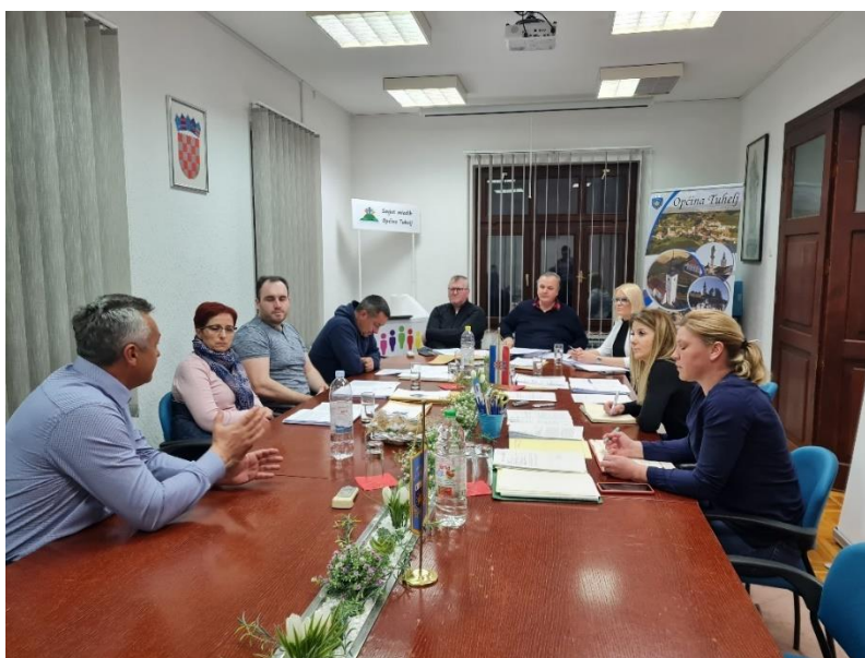
5. sjednica Općinskog vijeća Općine Tuhelj, 11.04.2022.