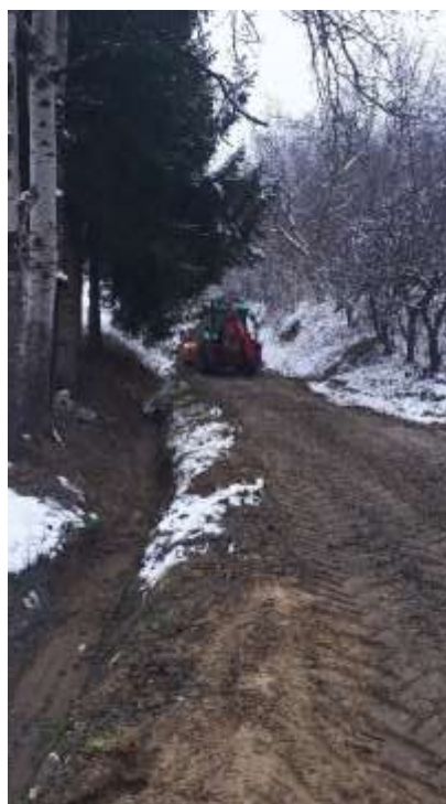
Sveti Križ, odvojak Vodopivec, 04.03.2021.