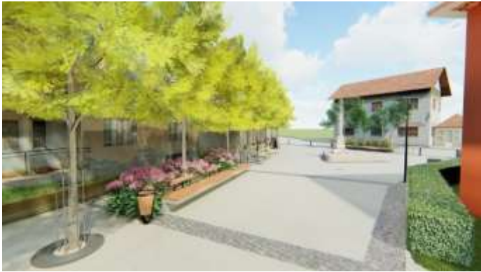
Slika 1: Trg u Tuhlju