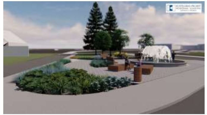
Slika 2: Park s fontanom u T. Toplicama

Projekcije proračuna za 2023. i 2024. godinu obuhvaćaju slijedeće kapitalne projekte čije se ostvarenje planira na temelju sufinanciranja projekata prijavljenih na javne natječaje: