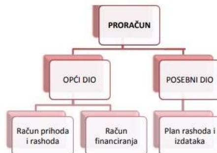
Slika 1: Struktura proračuna

Najkraće rečeno, proračun je plan prihoda i rashoda za neko vremensko razdoblje. Proračun Općine Tuhelj je akt kojim se procjenjuju prihodi i primici te utvrđuju rashodi i izdaci za jednu godinu s projekcijama za naredne dvije.