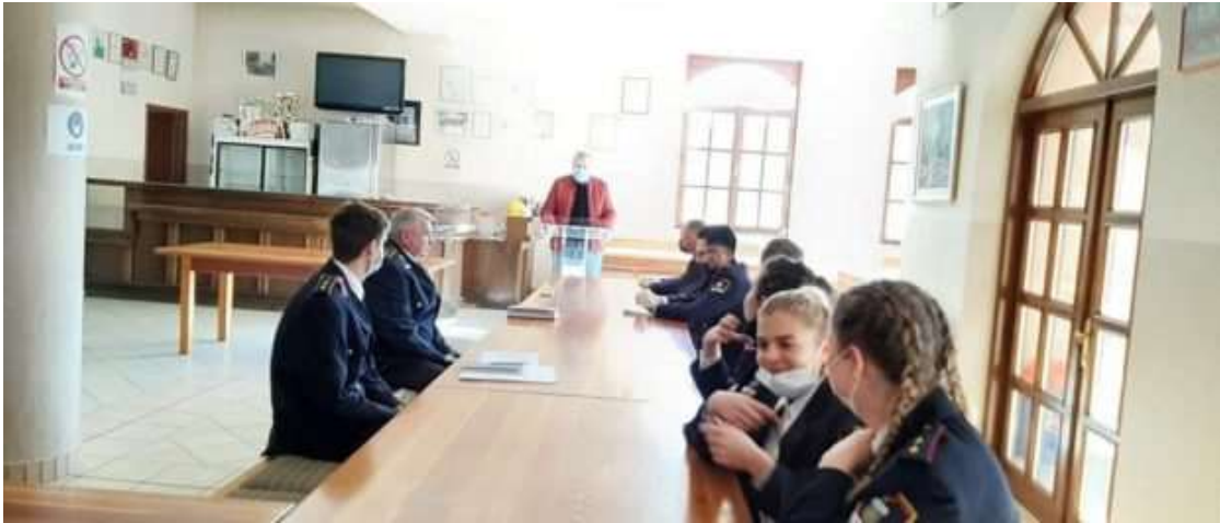
Vatrogasni dom u Tuhlju, 28.02.2021.