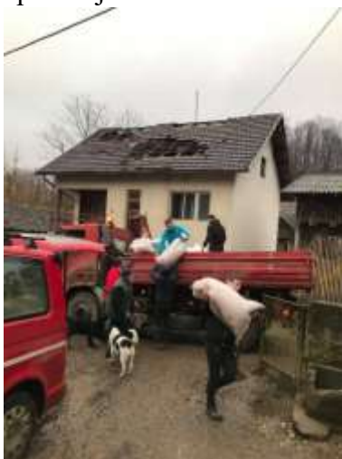
Banovina, siječanj 2021.