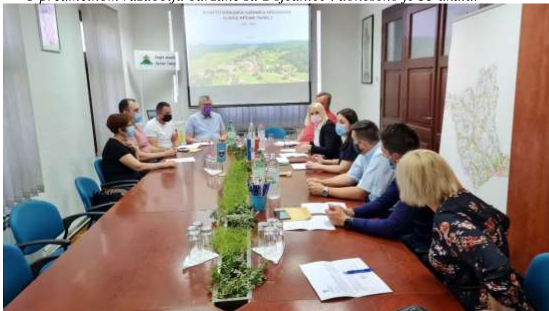
Konstituirajuća sjednica, 10.06.2021.

U predmetnom razdoblju održane su 2 sjednice i doneseno je 35 akata.