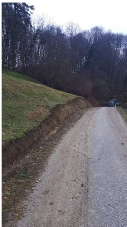
Banska Gorica, odvojak Kuhar, 03.03.2021.