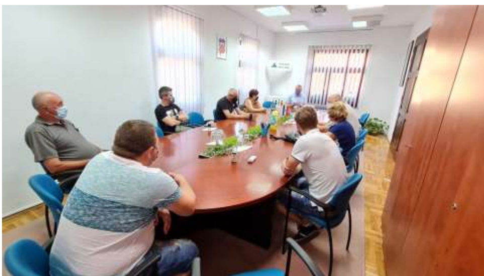
Općinska vijećnica, 29.06.2021.

Na javni natječaj za financiranje programa i projekata od interesa za opće dobro koje provode udruge na području Općine Tuhelj za 2021. godinu pristiglo je 11 prijavljenih projekata/programa od 11 udruga. Dana 17.06.2021. godine načelnik je donio Odluku o dodjeli financijskih sredstava za financiranje programa i projekata od interesa za opće dobro koje provode udruge na području Općine Tuhelj za 2021. godinu, dok je 29.06.2021. godine Općina potpisala ugovore o financiranju istih.