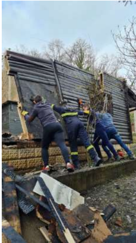
Članovi Savjeta mladih i ostali volonteri, ožujak 2021.