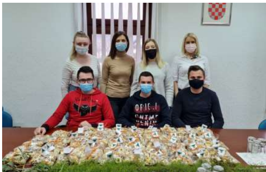
Članovi Savjeta mladih, ožujak 2021.