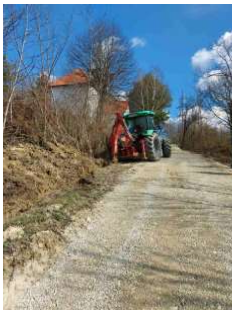
Sveti Križ, podno kapele, 19.03.2021.