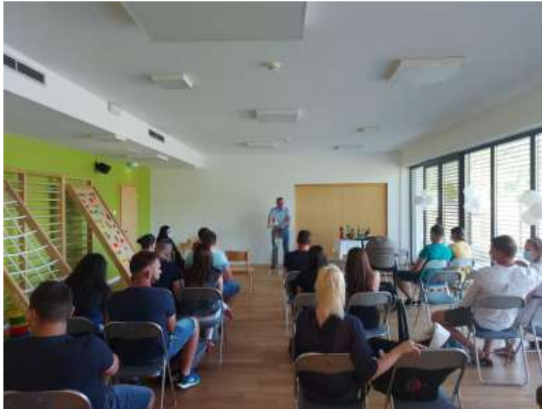
Dječji vrtić Potočić Tuheljski, prijem novorođene djece 29.06.2021.