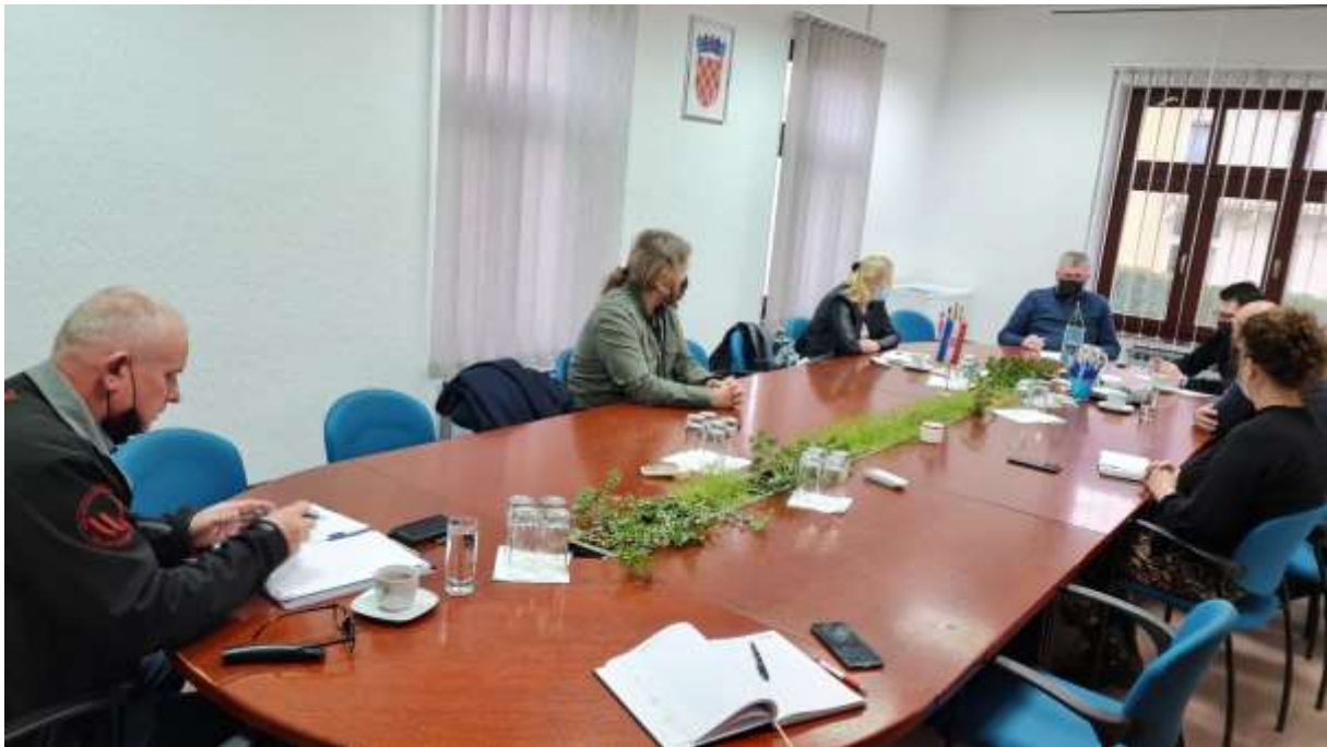
Sjednica Stožera civilne zaštite Općine Tuhelj, 09.03.2021.

Dana 14.04.2021. godine Načelnik stožera stavio je van snage Odluku o zabrani iznajmljivanja i drugog korištenja društvenih domova na području općine Tuhelj.