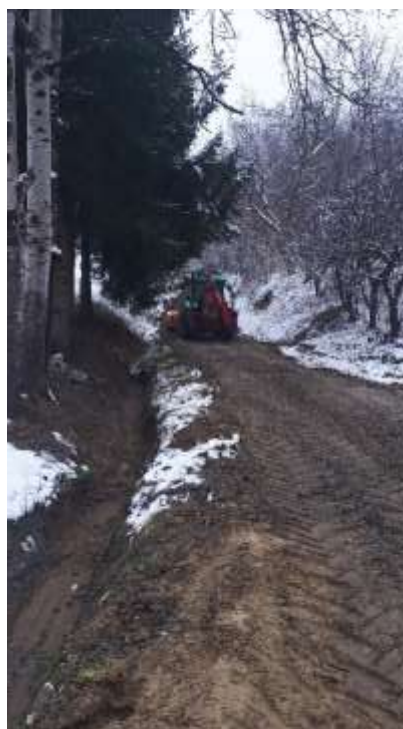
Sveti Križ, odvojak Vodopivec, 04.03.2021.