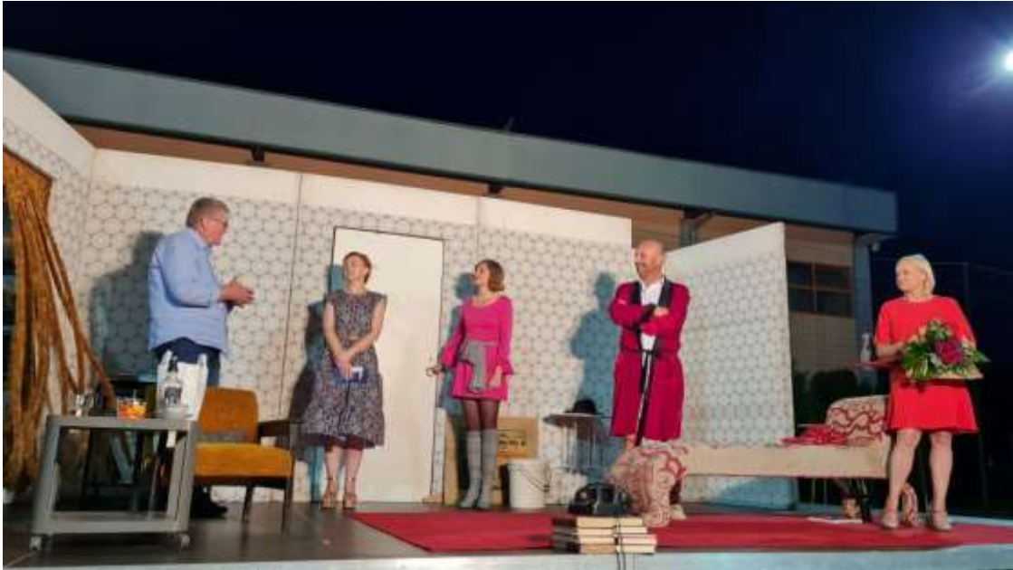
Tuhelj – igralište OŠ Lijepa naša, 30.06.2021.

U sklopu 14. GFUK-a, krajem lipnja na igralištu OŠ Lijepa naša održana je predstava “Dekorater”, KG “Lectirum” iz Zagreba.