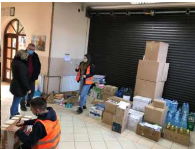
Vatrogasni dom u Tuhlju, siječanj 2021.