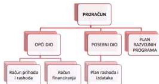
Slika 1: Struktura proračuna

Najkraće rečeno, proračun je plan prihoda i rashoda za neko vremensko razdoblje. Proračun Općine Tuhelj je akt kojim se procjenjuju prihodi i primici te utvrđuju rashodi i izdaci za jednu godinu s projekcijama za naredne dvije.