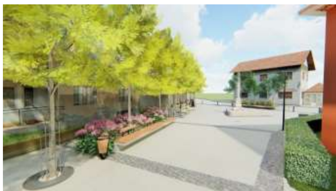
Slika 1: Trg u Tuhlju