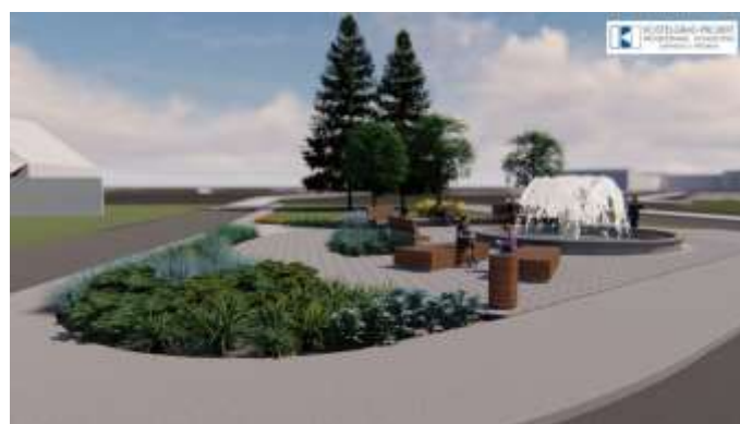
Slika 2: Park s fontanom u T. Toplicama